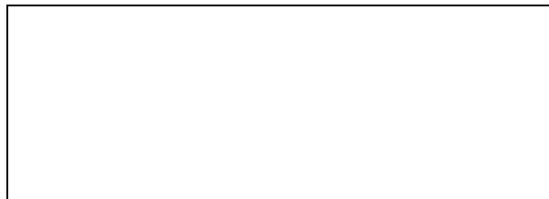
Tabuľka Kontrolný zoznam pre hodnotenie možných rizík